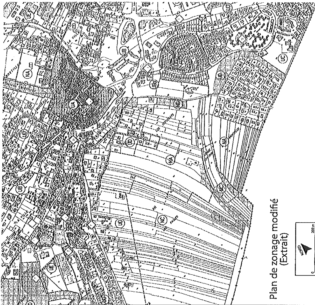
Plan de zonage modifié (Extrait)